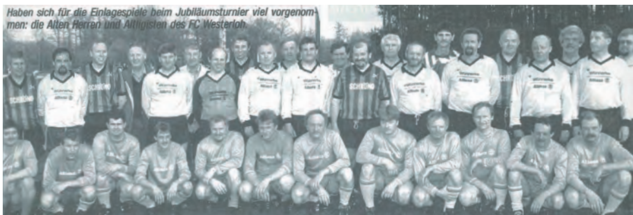
Haben sich für die Einlegespiele beim Jubiläumsturnier viel vorgenommen: die Alten Herren und Altligisten des FC Westerloh.

Im Themenfeld „Vereinschronik“ bekommt die Vereinsgeschichte die ihr gebührende Aufmerksamkeit. Josef Hessel war seit 1981 bis 2006 als Chronist tätig.