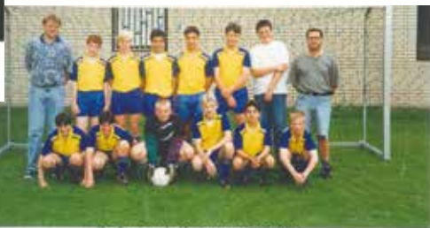
C-Jugend Meister 95/96