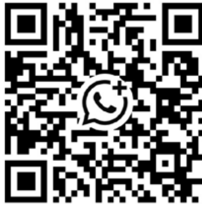
Der QR-Code führt direkt zum WhatsApp-Kanal